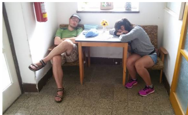
Vedoucí poslední den