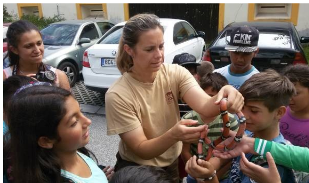
Návštěva Zoo Hluboká nad Vltavou