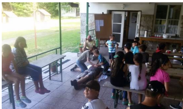
Základní zdravotnický kurz