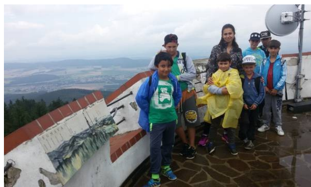
Rozhledna na Kletí