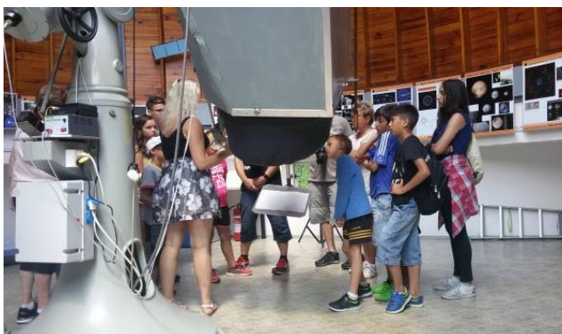
Hvězdárna na Kleti